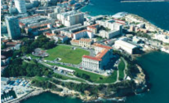
◀ LE PALAIS DU PHARO, VITRINE DE MARSEILLE