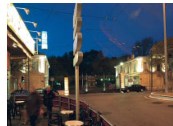
◀ ENTRÉE DU PALAIS DU PHARO, BD CHARLES LIVON

L'une des pièces maîtresses du quartier reste bien évidemment le Palais du Pharo et ses jardins. Les Marseillais doivent cette bâtisse au Prince-président Louis Napoléon Bonaparte, qui fut séduit par le site lors d'un voyage en septembre 1852. Le futur empereur désirait