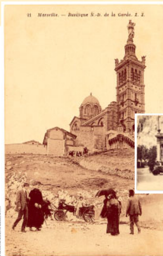
(F 125)