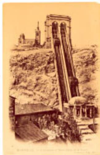
© ARCHIVES MUNICIPALES DE MARSEILLE (F 127)

La Révolution sera pour Notre-Dame de la Garde la période la plus sombre de son histoire. Bien national depuis 1789, elle reste cependant ouverte au culte jusqu'en 1793 où les édifices religieux sont désaffectés. La Vierge à l'Osten-