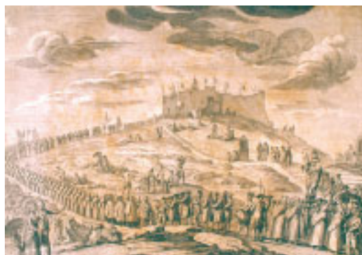
© ARCHIVES MUNICIPALES DE MARSEILLE (F 115)