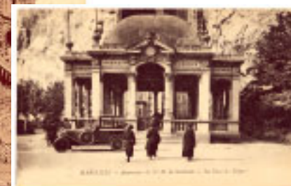
▲ LA GARE DE DÉPART.

qui travaille en même temps sur les plans de la nouvelle cathédrale.